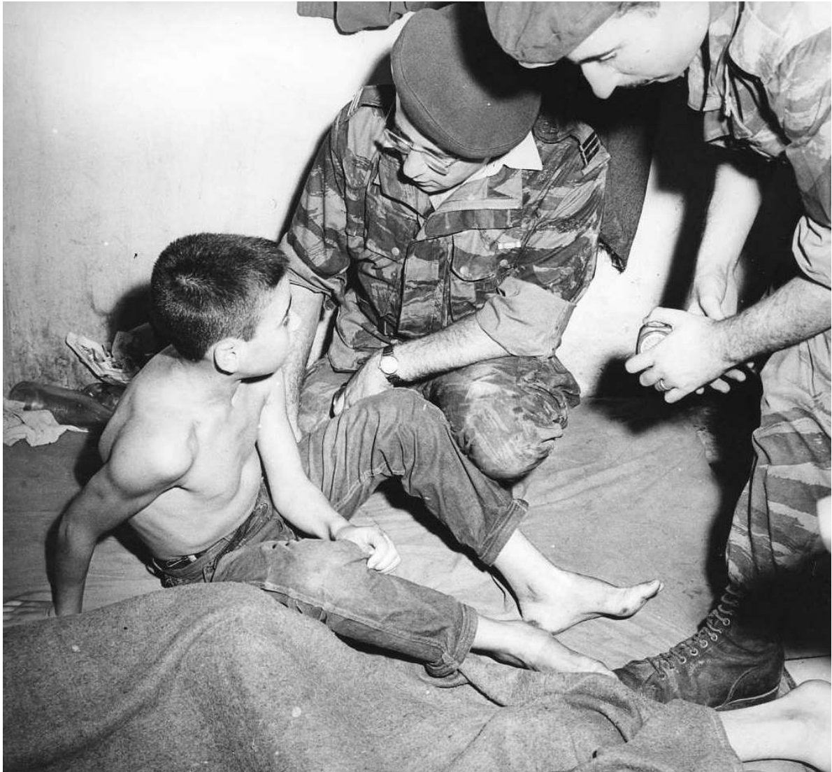
Figure 2. Maraude dans les bains maures pour récupérer les yaouleds, 1958 ou 1959