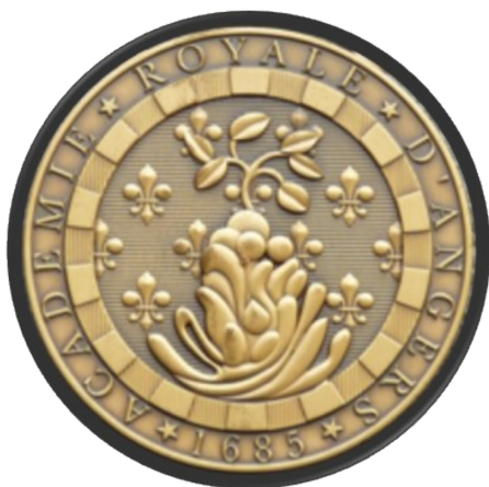
Médaille de l'Académie des Sciences, Belles-Lettres et Arts d'Angers.