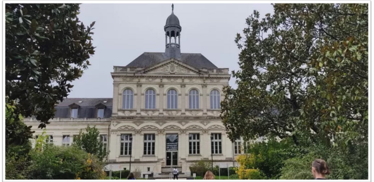
Université Catholique de l'Ouest.