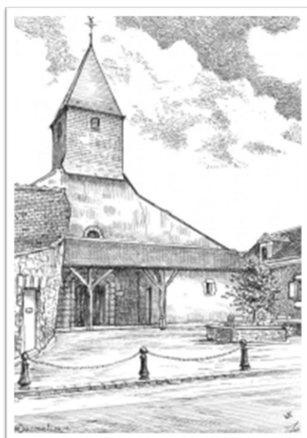
Église de Saint-Melaine.