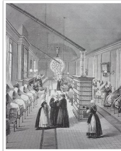
La crèche de l'hospice des Enfants-trouvés créé à Paris par saint Vincent de Paul.

Mais pour tenter d'illustrer la parenté intime entre les deux hommes, je pencherais pour deux traits communs de caractère : l'éclectisme littéraire et artistique qu'ils cultivent, chacun s'essayant l'un à la poésie, l'autre au roman, mais les deux au journalisme, aux récits de voyage, à la critique, aux textes et biographies historiques avec le même bonheur. Et puis leur esprit rêveur, presque de méditation devant la nature ou les hommes . Il n'est que d'entendre ce que disent de Victor son père : « Victor est comme un cerf-volant ; plus on tire sur la corde pour le ramener à terre, plus il pointe », son frère : « [...] l'affaire du moment était ce qui le captivait le moins [...]. La poésie était son élé-