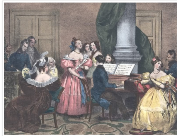
Salon musical, vers 1840.

Le passage ci-dessus ne figure pas dans l'édition de 1926. Est-ce à dire que l'enthousiasme du jeune Bazin a diminué avec l'âge ? Ou que l'éloge paraissait démenti par l'oubli constaté depuis quatre décennies concernant Pavie ?