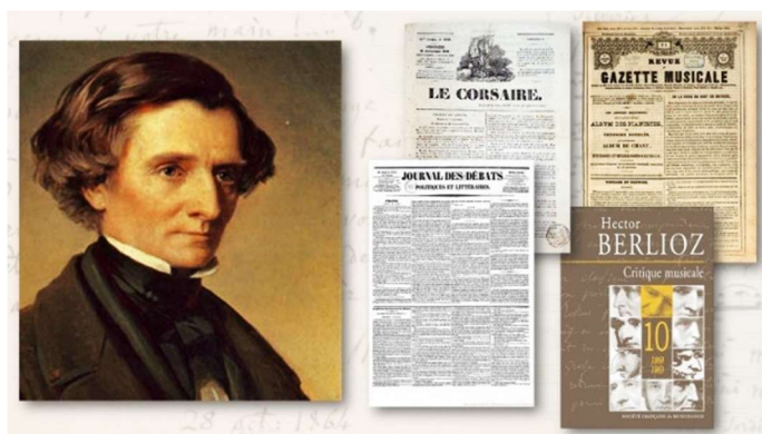
Hector Berlioz, articles critiques

À la question première de cette communication, de savoir si Berlioz mania aussi bien la plume que la baguette, chacun se fera donc son avis, et à une seconde qui serait : « Berlioz, écrivain ? » je répondrai avec juste un peu de malice : « Oh ! il n'a pas été qu'écrivain ! »