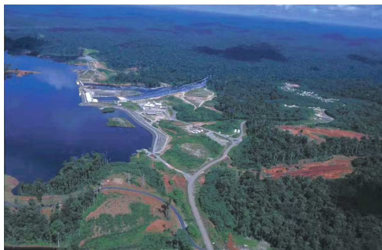
Barrage de Petit-saut en Guyane.

Mais l'implantation d'une telle infrastructure en pleine forêt tropicale a engendré une agression majeure pour l'environnement, conduisant à l'immersion de 365 km 2 de forêt primaire.