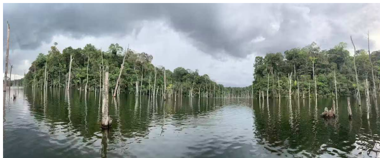
Le lac du Petit-Saut, en Guyane française.

La disparition, par l'exploitation, des bois morts provoquerait ainsi un second bouleversement majeur du paysage et des écosystèmes qui ont réussi à s'adapter depuis 30 ans. En outre, comme tous les sols de Guyane, le lac est le réceptacle de mercure d'origine naturelle, mais aussi issu de l'orpaillage illégal : la coupe de bois mort pourrait contribuer à augmenter la contamination des écosystèmes et des espèces présentes.