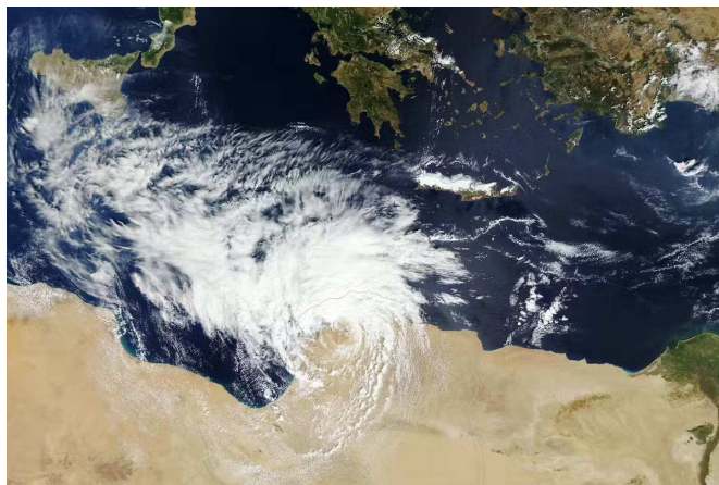
Le Medicane Daniel le 10 septembre 2023. Image MODIS du satellite Terra de la NASA. Cliquer pour zoomer.

À l'amont de la catastrophe, il y a tout d'abord un aléa : le cyclone subtropical Daniel, un Médicane , contraction de Mediterranean hurricane .