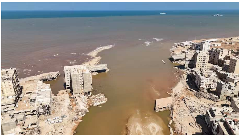
L'inondation a causé l'effondrement du pont entre l'est et l'ouest de la ville de Derna le 10 septembre dernier.