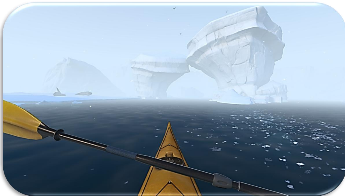
Capture d'écran de l'expérience virtuelle National Geographic VR