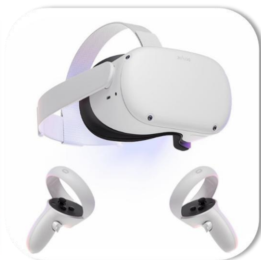
À gauche : Participant assis dans le kayak. À droite : le matériel de RV utilisé : le visiocasque Meta Quest 2 et ses contrôleurs les Meta Touch