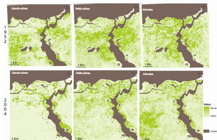
Figure 2. Densité de ligneux en 1952 et en 2004 (carroyage 100m). Région de Sadia

Dans une troisième étape, à partir de ces résultats spatialisés, nous avons généré des cartes des types de paysages et particulièrement des types de parcs agroforestiers en 2004 et en 1952. En effet, selon la part et la densité respective des trois classes de ligneux, auxquelles on ajoute celle des formations herbacées, on peut définir différents types de parcs. Pour cela nous avons calculé des densités de ligneux total et par type à partir de la carte des ligneux ponctuels sur la base d'une grille de 100 m de coté (figure 2).