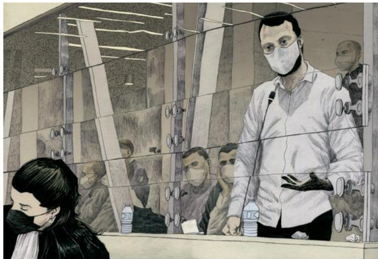
Image 2 : Dessin d'Ivan Brun d'un interrogatoire de Salah Abdeslam lors d'une séance du procès des attentats du 13 novembre 2015, cour d'assises spéciale de Paris, 9 février 2022.

Interrogatoire de Salah Abdeslam, devant la cour d'assises spéciale de Paris, le 9 février 2022. IVAN BRUN POUR "LE MONDE"