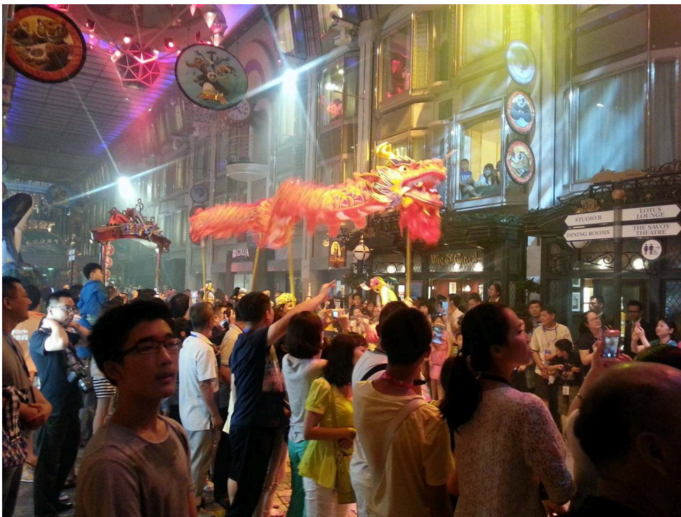
Photographie 1. Grande parade à bord du Mariner of the Seas, RCI, juillet 2015