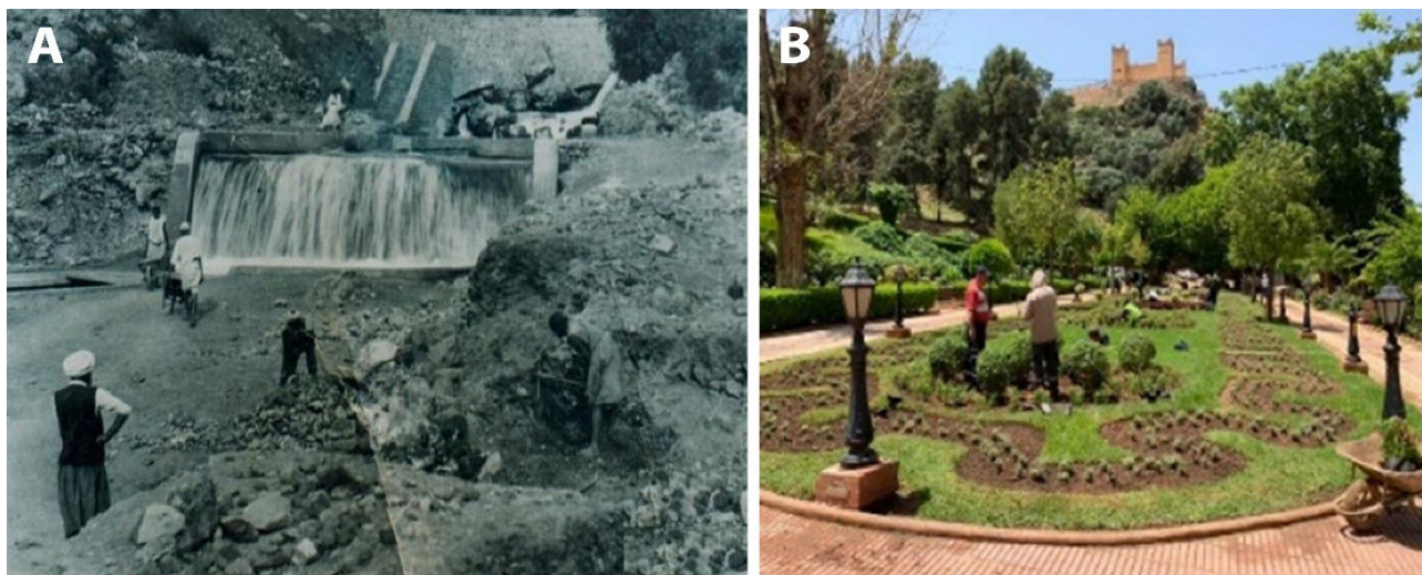
Figure. 3 - Transformations du site au cours du temps. A : Le site en 1934, en travaux, avec sa chute d'eau artificielle. B : Le site en 2020, avec ses jardins et plantations.2002).