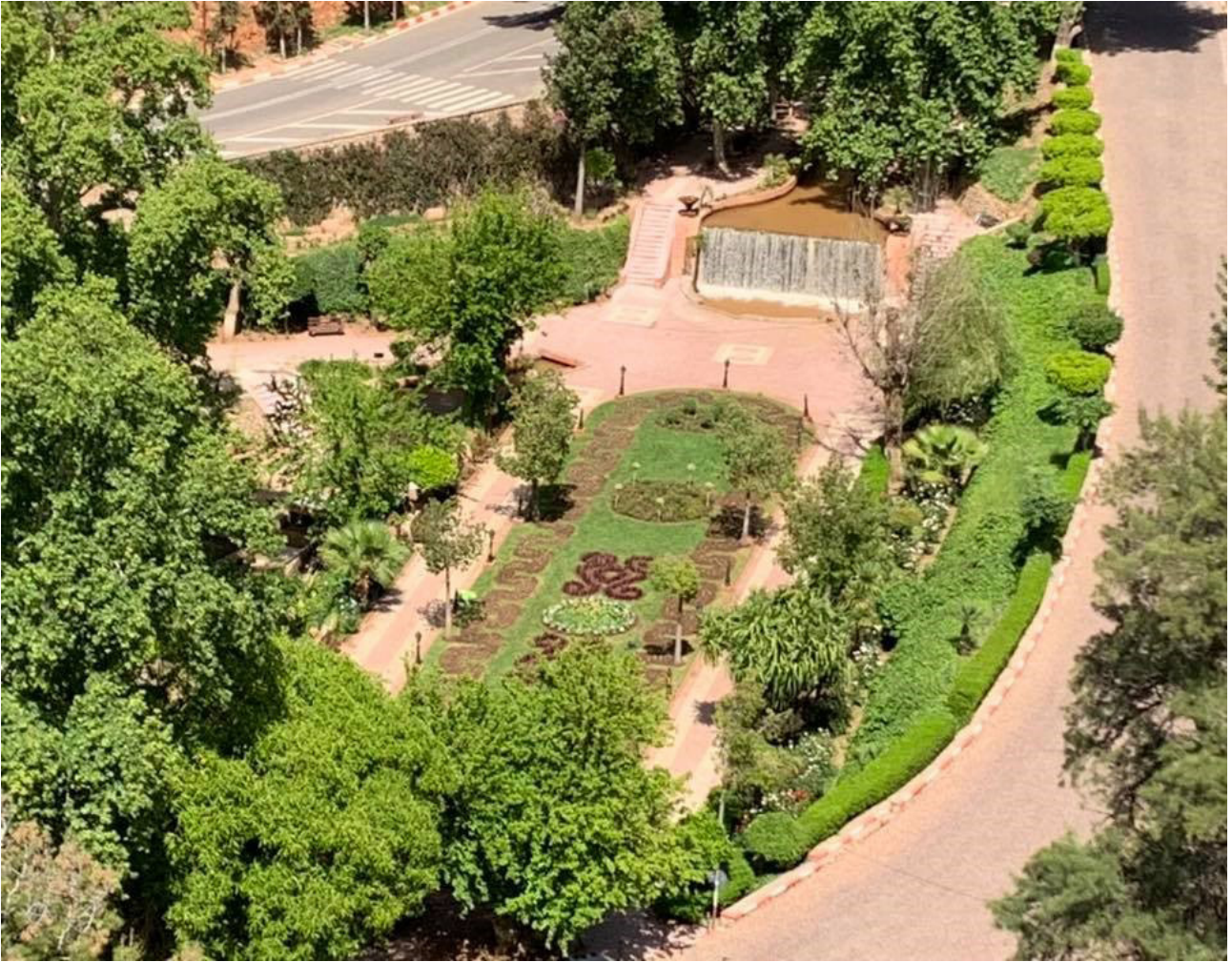
Figure. 1 - Vue générale du géomorphosite d'Ain Asserdoune. Photo Ait Omar, avril 2020.