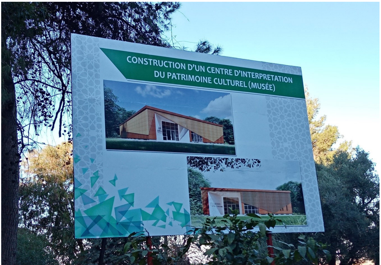
Figure. 6 - Projet de musée du patrimoine local (Conseil Régional Béni Mellal - Khenifra 2021). mars 2021.