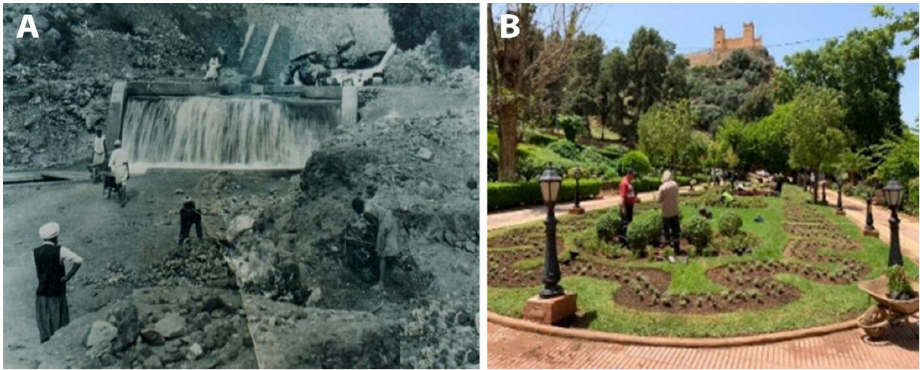
Figure. 3 - Transformations du site au cours du temps. A : Le site en 1934, en travaux, avec sa chute d'eau artificielle. B : Le site en 2020, avec ses jardins et plantations.2002).