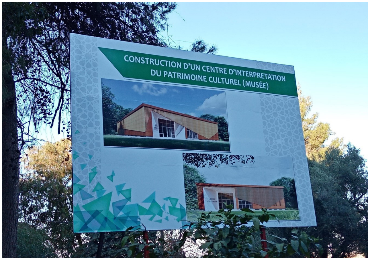
Figure. 6 - Projet de musée du patrimoine local (Conseil Régional Béni Mellal - Khenifra 2021). Photo Ait Omar, mars 2021.