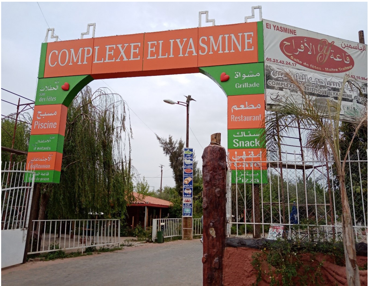
Figure. 5 - Complexe touristique implanté à quelques centaines de mètres du site d'Ain Asserdoune. Photo Ait Omar, mars 2021.