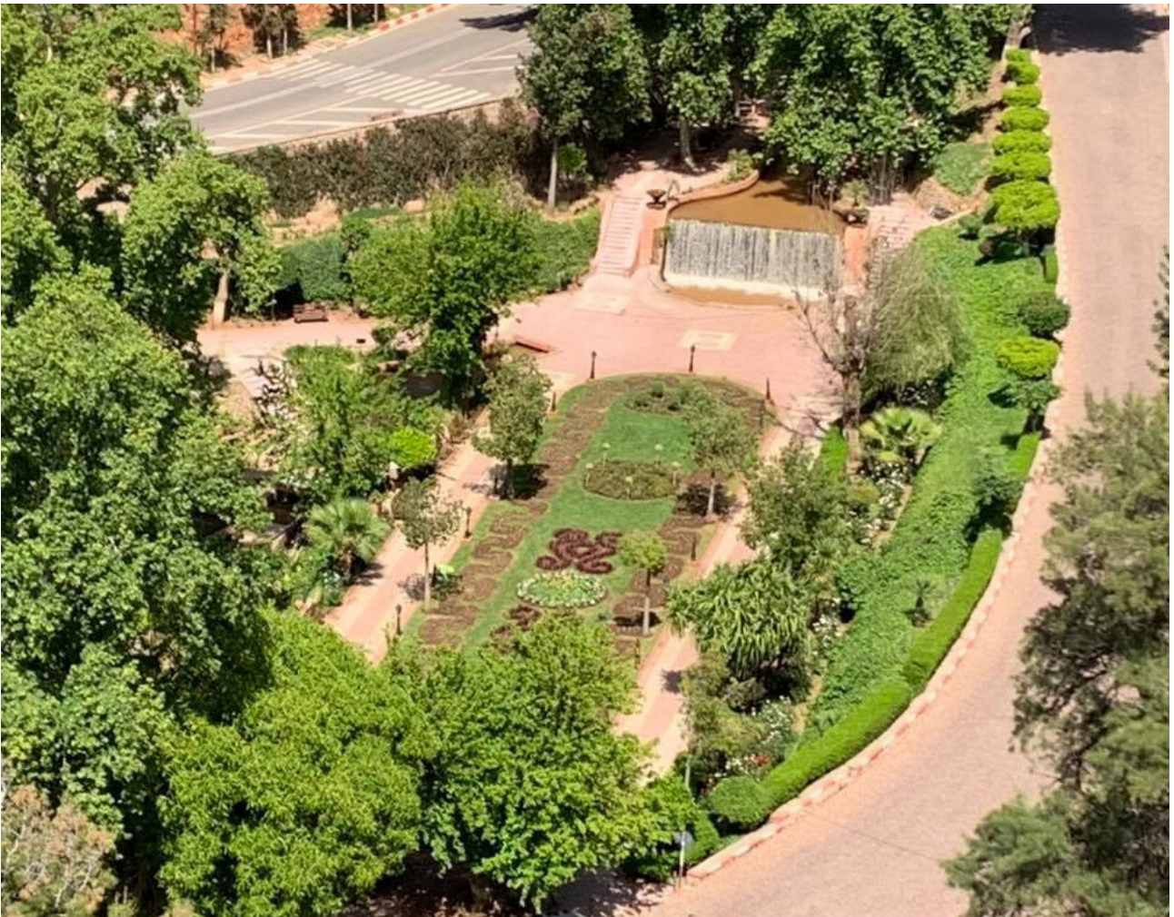
Figure. 1 - Vue générale du géomorphosite d'Ain Asserdoune. Photo Ait Omar, avril 2020.