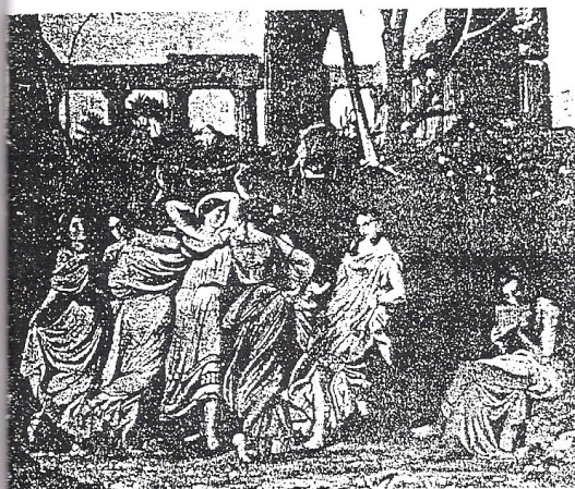
Victor Mottez, la Danse. Photo prise en 1854. (Collection particulière).