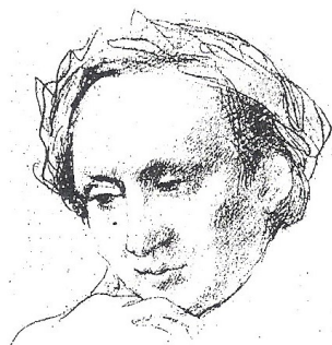
Victor Mottez, dessin. Etude préparatoire pour "La Musique".