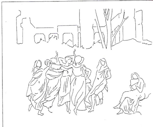
1 - Mme Cuvillier-Fleury. 2 - ? 3 - Julie Mottez. 4 - Mme Jules Janin.