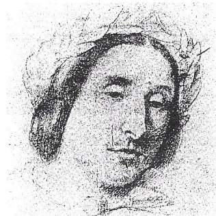
Louise Bertin - Dessin - Etude préparatoire pour "La Musique".