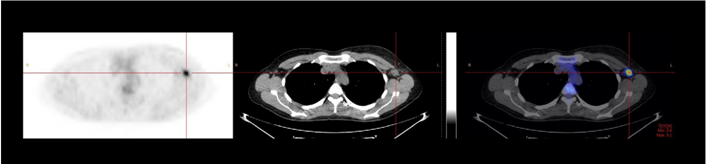
Fig. 2. Patiente de 37 ans présentant un carcinome canalaire infiltrant grade II, RH–, Her2+. La TEP-FDG initiale montre un foyer hypermétabolique (SUVmax à 5,2) en regard d'un ganglion axillaire homolatéral. Une cytoponction préthérapeutique avait mis en évidence un envahissement métastatique axillaire. L'histologie du curage axillaire réalisé après chimiothérapie néo-adjuvante se révèle négative, NB selon la classification de Sataloff.

Thirty-seven years old patient with an infiltrating ductal carcinoma grade III, hormone receptors negative, Her2 positive. Initial FDG-PET shows an uptake (SUVmax = 5.2) in an ipsilateral axillary lymph node. Fine needle aspiration performed before the beginning of the treatment had revealed a metastatic axillary involvement. Histology of axillary dissection performed after neoadjuvant chemotherapy proved negative, NB Sataloff's classification.