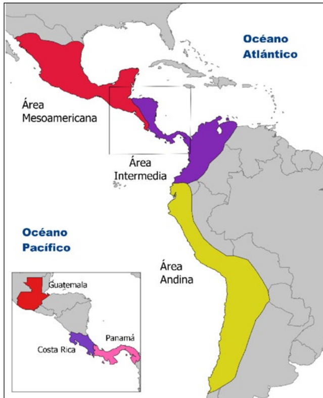
Figura 1 MAPA DE UBICACIÓN ÁREAS CULTURALES MESOAMERICANA, ANDINA Y CHIBCHENSE