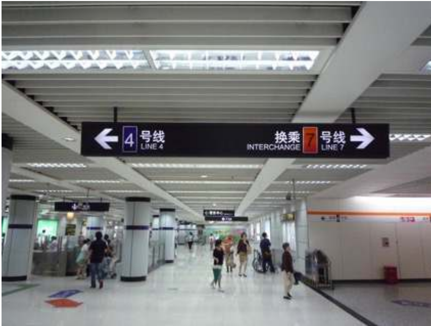
Figure 10. Signalétique au croisement des lignes 4 et 7 à la station de Dongshan Road South

Outre la qualité de la signalétique, cette photo souligne également les atouts d'une construction récente, quand on compare l'espace vaste et clair de la station à l'exiguïté et à l'atmosphère glauque de nombreuses stations du métro de New York – fig. 2.