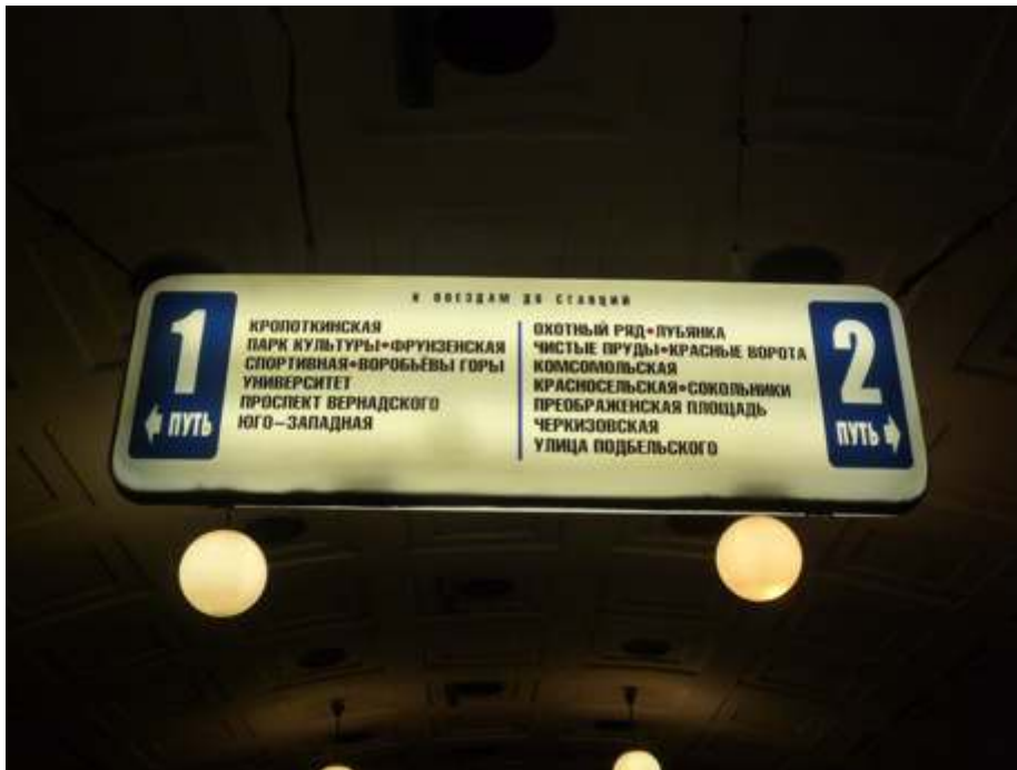
Figure 3 : Signalétique dans le métro de Moscou

Un panneau lumineux indique les stations desservies par les rames de la ligne rouge (voir tableau 3). Cela révèle également le dispositif de quai central séparant les deux voies ou itinéraires (ПУТЬ) 1 et 2, avec les stations desservies dans chaque sens.