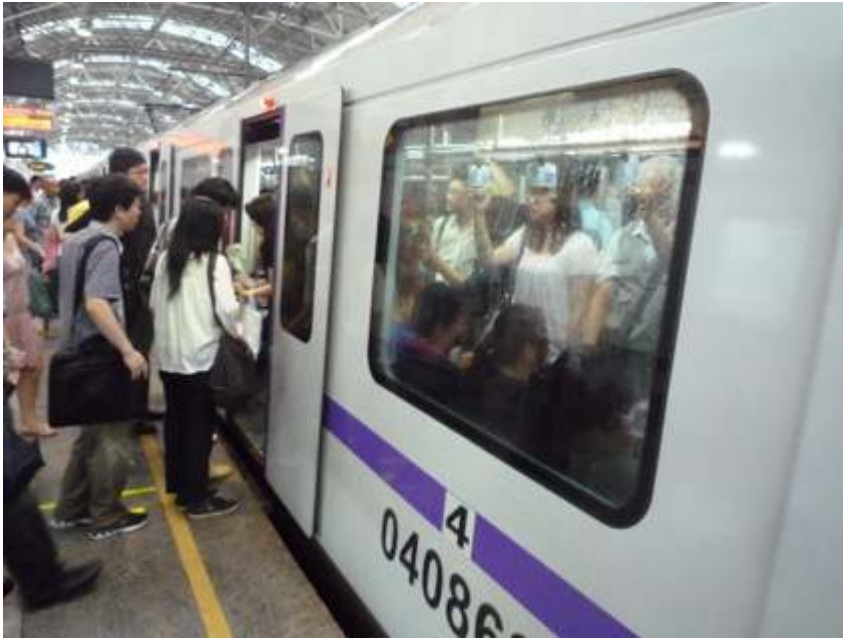
Figure 4 : Rame du métro de Shanghai

Le numéro de la ligne est clairement indiqué sur le flanc du wagon (4, au premier plan), ce qui permet d'informer le voyageur sur cette voie empruntée alternativement par des trains des lignes 3 et 4.