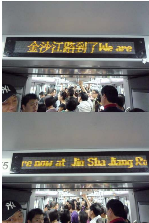
Figure 11 : Information dans les rames à Shanghai

Information dans les rames par affichage lumineux bilingue (ici « [You a]re now at Jin Sha Jiang Road ») et annonce sonore.