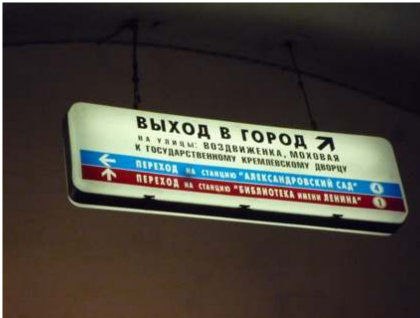
Figure 6 : Signalétique directionnelle à Moscou

Signalétique directionnelle : en haut en noir, indication de la sortie ; en bas en bleu et rouge, les directions vers les deux lignes, la n° 4, bleu clair, vers la gauche, la n° 1, rouge, tout droit.