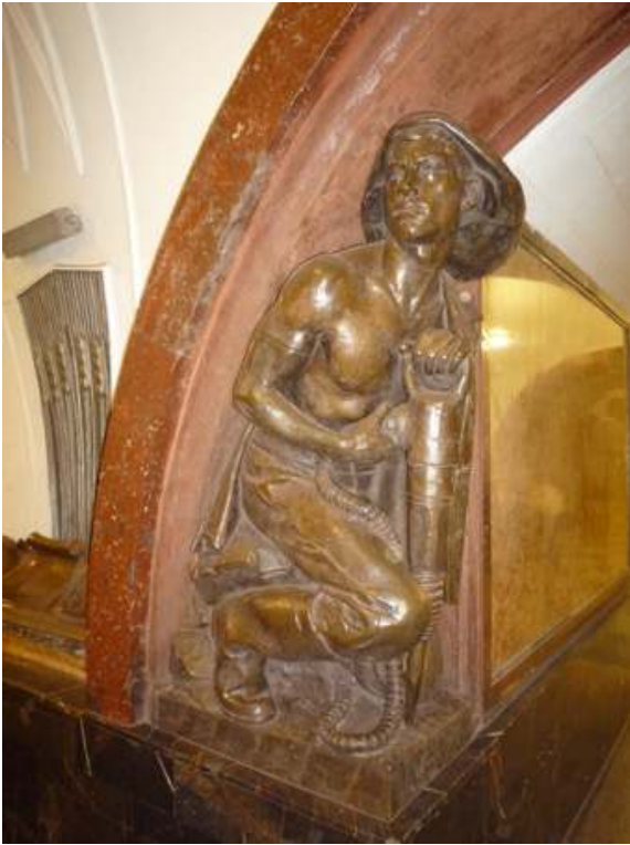
Figure 8 : Le métro de Moscou comme objet touristique

Le métro de Moscou constitue un objet touristique, ici station Park Koulouri ; pourtant l'accessibilité n'est pas facilitée pour les touristes.