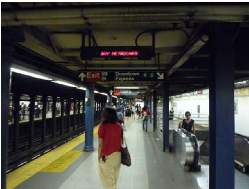
Figure 2. Signalétique dans la station de la 59 e rue à New York

Il est clairement mentionné que le quai au premier plan permet d'accéder aux rames de la ligne 6, express vers downtown , alors que l'accès aux rames des lignes 4 et 5 s'effectue au niveau inférieur accessible par l'escalator situé à l'arrière-plan à droite. La sortie est également clairement mentionnée.