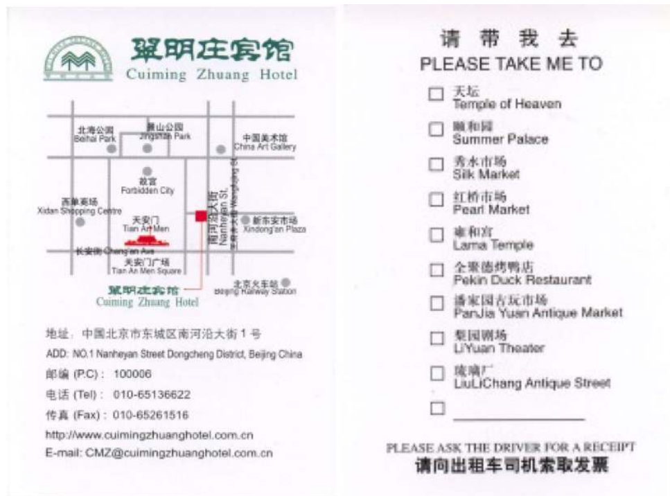
Figure 1 : Fiche cartonnée distribuée dans les hôtels à Beijing

Fiche cartonnée (format carte de visite) distribuée dans les hôtels que les touristes cochent et remettent au chauffeur de taxi à Beijing. Cette technologie permet une découverte autonome de la ville, c'est-à-dire sans recours aux agences réceptives ou aux voyagistes.