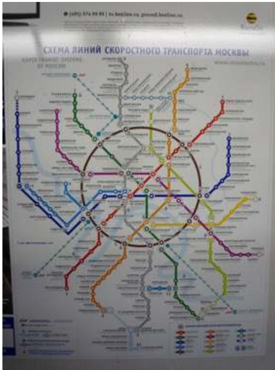
Figure 7 : Plan du réseau du métro de Moscou

La transcription en alphabet latin sur le plan est de peu d'utilité tant que la signalétique du réseau (nom des stations, des lignes...) demeure en cyrillique.