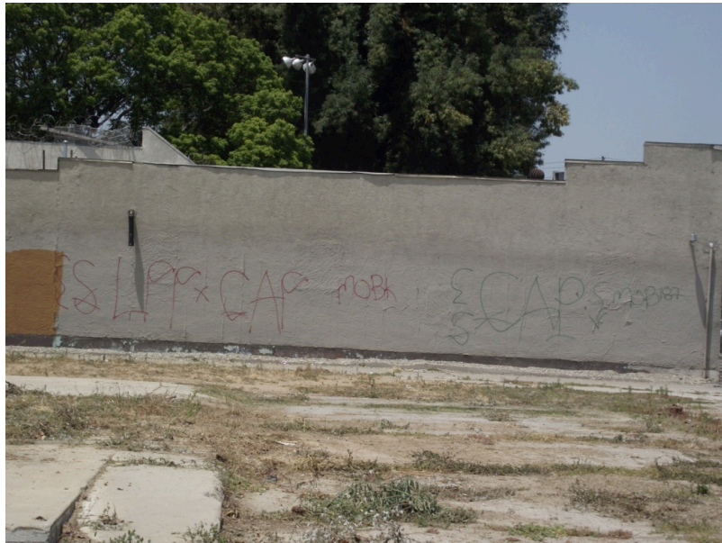
12. L'alliance des LPP et des CAP contre les Mob Pirus (Le Moigne, 2011)

L'inscription « ES LPP x CAP MOBk », sur la gauche, indique que les East Side Lueders Park Pirus sont associés aux Cross-Atlantic Pirus dans leur rivalité contre les Mob Pirus (le « MOBk » au milieu de la composition indique que les LPP et les CAP se revendiquent officiellement « tueurs de Mob »). Cela complète l'autre partie du graffiti qui consiste en une revendication territoriale des CAP (on aperçoit une flèche pointée vers le bas) ainsi qu'une déclaration de guerre aux Mob (« MOB187 », 187 étant la section du code pénal californien se référant au meurtre).