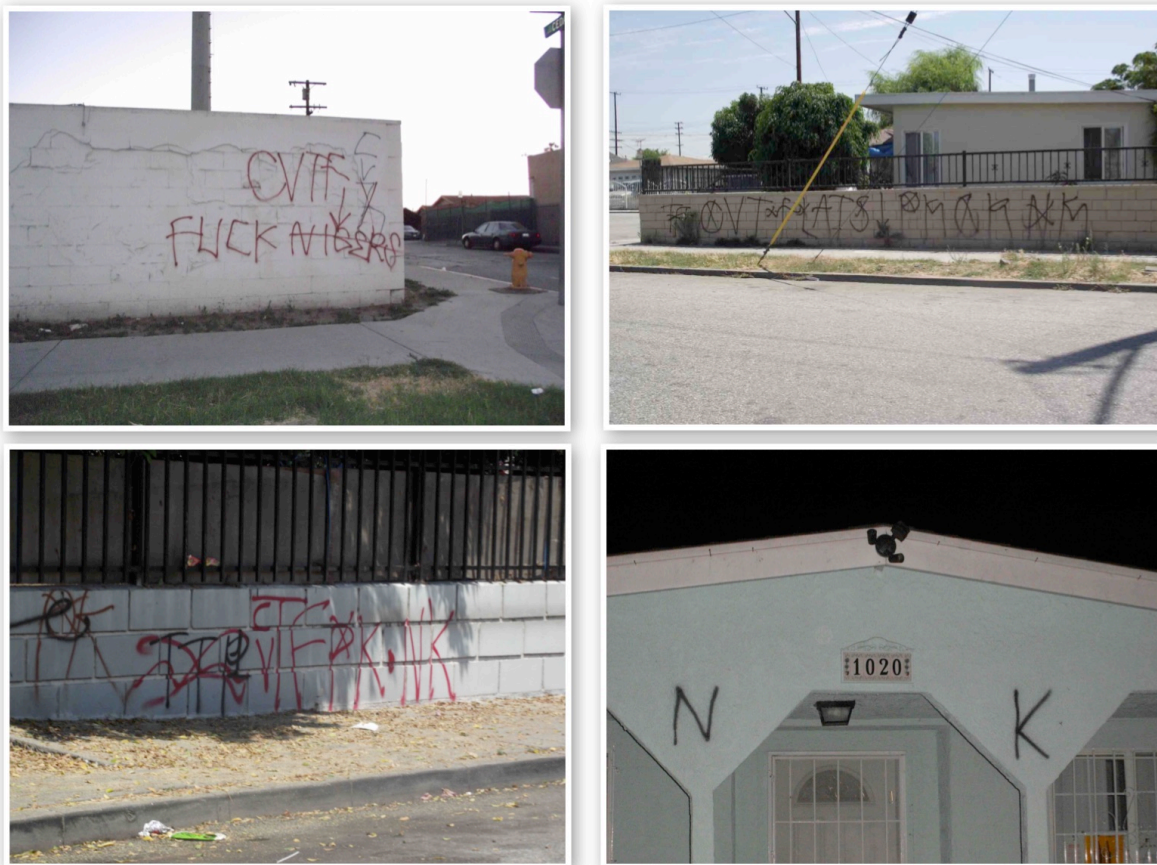
13. Exemples de graffitis racistes réalisés par des membres de gangs latinos (Le Moigne, 2009, 2011)

Le graffiti représenté sur la première photographie, en haut à gauche, est l'œuvre d'un membre des CVTF faisant la promotion de son gang en insultant les « nègres » (terme qu'il a d'ailleurs mal orthographié). Il fut réalisé sur une des artères principales de la ville à la vue des milliers d'automobilistes l'empruntant chaque jour. Le deuxième, en haut à droite, est également l'œuvre d'un membre des CVTF . On peut y lire « CV T-Flats ↓ PK CK NK », le « PK » signifiant « Piru Killers » (tueurs de Piru ), le « CK » signifiant « Crip Killers » (tueur de Crip ), et le « NK » signifiant « Nigger Killers » (tueurs de nègre). La troisième photographie représente encore un graffiti réalisé par un membre des CVTF . On peut y apercevoir un graffiti des TTP barré, à côté duquel ont été inscrits « PK » ( Piru Killers ) et « NK » ( Nigger Killers ). Le dernier graffiti, plus sobre, consiste simplement en un « NK » inscrit au-dessus du porche d'une maison par un membre des CV3 .