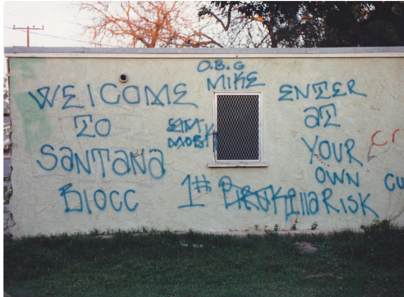
7. Le marquage territorial des Santana Blocc Compton Crips (Taylor, 1987)

Sur ce graffiti réalisé aux environs de 1987, les Santana Blocc Compton Crips (un gang noir du Nord de la ville) marquent l'entrée de ce qu'ils considèrent comme leur territoire et préviennent les « étrangers » souhaitant s'y aventurer qu'ils le font à leurs risques et périls (« Welcome to Santana Blocc. Enter at your own risk »). Au-delà de la promotion de son gang (volontairement présenté comme un gang dangereux) et de la matérialisation d'une frontière territoriale, l'auteur ( O.B.G Mike ) envoie plusieurs messages aux principaux rivaux des Santana Blocc et plus globalement à l'ensemble des Pirus (le nom générique donné à l'ensemble des gangs bloods de Compton). Le graffiti contient notamment l'inscription « I# Piru Killa » qui présente les Santana Bloccs comme les principaux tueurs de Pirus . Cette pratique constitue une autre fonction importante des graffitis de gangs que nous allons aborder maintenant : la mise en lumière de l'état des rivalités de pouvoir à un instant t entre les différents gangs de la ville.