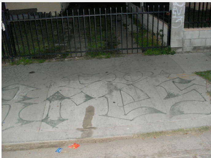
6. Un exemple rare de graffiti Old English dans une rue de Compton (Le Moigne, 2009)

Ce graffiti, qui représente le nom du gang CV3 (CV Tres) , a été réalisé dans le cœur du territoire du gang, et plus particulièrement dans une rue où le niveau d'activité des membres du gang est extrêmement élevé, ce qui signifie que peu de membres de gangs rivaux osent s'y aventurer 8 . L'auteur du graffiti a donc eu tout le loisir de s'appliquer.