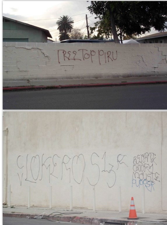
5. Simplicité typographique des graffitis de gangs (Le Moigne, 2011).

Les photographies ci-dessus illustrent la grande simplicité typographique commune aux graffitis de gangs noirs et latinos de Compton. La première représente l'œuvre d'un membre des Tree Top Pirus , un gang africain-américain du Nord de la ville, qui n'a eu pour seul objectif que de rendre visible le nom de son gang, sans stylisation ou ornementation particulières. La seconde représente un graffiti réalisé par un membre des CV Lokos 13 , un gang latino voisin des Tree Top Pirus . La composition contient une référence aux membres de ce gang ( CV Lokeros 13 ), suivie d'un « R » signifiant « Rifa » – un terme de l'argot mexicain-américain fréquemment utilisé par les gangs latinos pour indiquer qu'ils contrôlent le territoire en question – et des surnoms de quatre membres du gang. Si l'on remarque dans ce deuxième graffiti une légère tentative de se démarquer du style simpliste des graffitis effectués par les gangs noirs, les effets de style apportés par son auteur n'ont cependant rien à voir avec la sophistication des graffitis de gangs latinos qui pouvaient fréquemment être observés dans les années 1970-1980 et que l'on observe toujours aujourd'hui sur certains territoires ayant une densité de gangs beaucoup moins élevée. Au cours des seize mois passés sur le terrain, je n'ai eu l'occasion de voir un graffiti de gang latino réalisé en style Old English qu'à une seule reprise (voir figure 6).