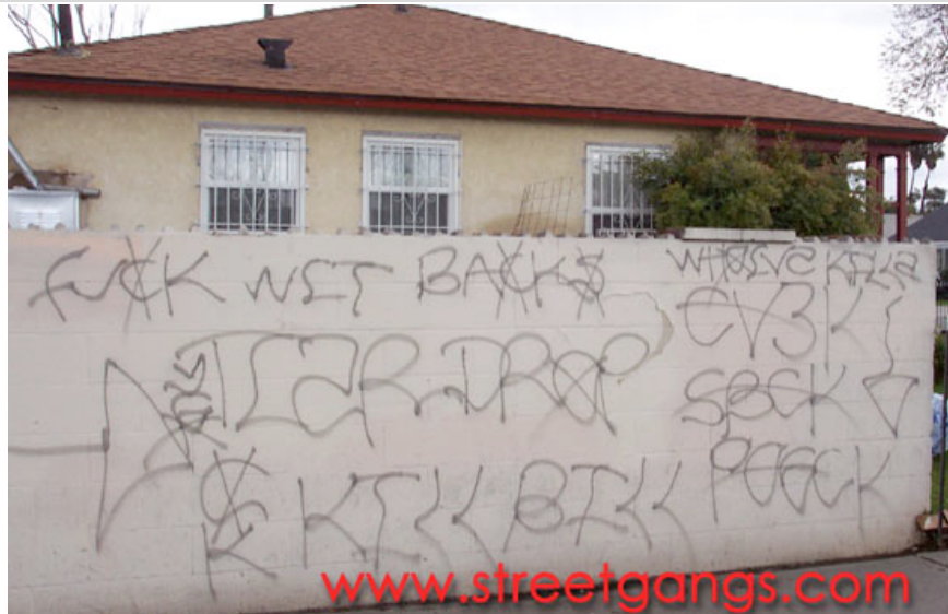
14. Exemple rare de graffiti raciste réalisé par des membres de gangs noirs (Alonso, 2005, http://www.streetgangs.com/bloods/compton/mobpiru#sthash.GG2uOIWM.dpbs )

Ce graffiti fut réalisé par des membres des Mob Pirus en 2005, année au cours de laquelle les tensions entre gangs noirs et latinos étaient à leur comble (Le Moigne, 2016). On peut y lire des affronts classiques comme le « CK » destiné aux Crips , ou des attaques contre les ennemis principaux du gang à l'époque : CV3K, SBCK ( Santana Blocc Crips Killers ), POGCK ( Palm and Oaks Gangster Crips Killers ; les POGC sont un gang de la ville voisine de Lynwood). Ils revendiquaient même le fait de n'avoir que des ennemis en inscrivant, dans la partie supérieure droite du graffiti « Whoeva Killa » (« tueur de qui que ce soit »). Mais ce qui constituait une évolution majeure par rapport aux décennies précédentes, c'était la dimension ethnique de ce graffiti caractérisée par l'inscription : « Fuck wet backs », en référence aux immigrants mexicains 10 .