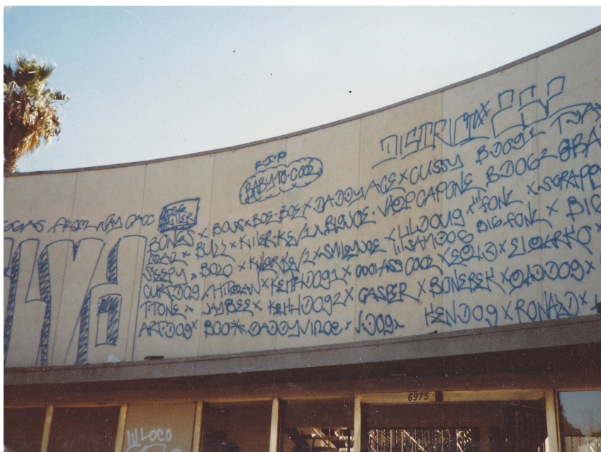
2. Gang roll call (Taylor, 1987)

Dans les années 1980 et 1990, les faibles effectifs de la police de Compton et les moyens limités de la municipalité combinés au nombre très élevé de membres de gangs eurent pour conséquence de voir les graffitis fleurir sur les murs de la ville. À l'époque, le manque de pression policière et l'explosion de la culture des gangs permettaient aux membres de gangs de réaliser des graffitis assez chargés comprenant beaucoup d'informations, comme sur la photographie ci-dessous, mise à ma disposition par Hourie Taylor (chef du Compton Police Department de 1992 à 2000).