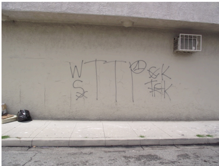
10. Graffiti agressif réalisé par un membre des Tree Top Pirus (Le Moigne, 2011)

Les gangs peuvent également employer une symbolique plus complexe, comme dans l'exemple ci-dessous. Ici, un membre des TTP fait la promotion de son gang sur son propre territoire, tout en s'attaquant à ses rivaux. Il revendique à la fois la supériorité de son gang et de l'ensemble des Pirus en positionnant le chiffre « 1 » à l'intérieur du « P », et il annonce à la fois que les TTP revendiquent leur statut d'ennemis mortels des Crips et des CVTF en écrivant « CK » et « TFK », respectivement pour « Crips Killers » et « Tortilla Flats Killers », tout en rayant le « C » et le « TF », comme pour leur manquer doublement de respect.