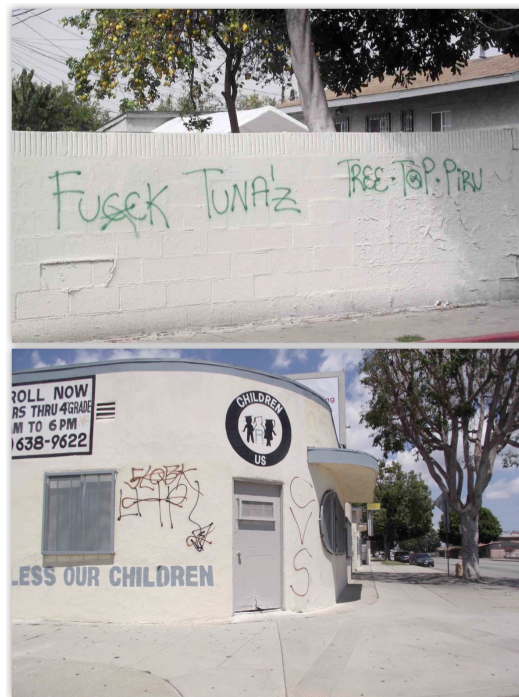
11. Le graffiti comme vecteur de dénigrement des rivaux (Le Moigne, 2011)

étant un terme dégradant désignant une femme peu attirante, utilisé comme une insulte envers les Bloods ).