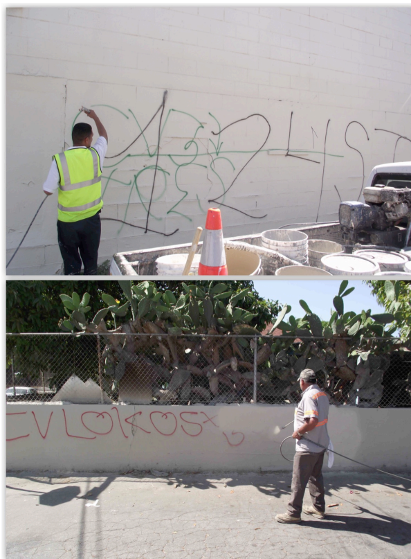
15. L'enlèvement des graffitis : un enjeu doublement politique (Le Moigne, 2011, 2012)

Les graffitis, en particulier dans leurs formes les plus agressives, jouent un rôle important dans le maintien des tensions car ils constituent un acte de défiance et d'irrespect envers un gang rival, a fortiori lorsqu'ils sont réalisés sur le territoire de ce gang. Chaque graffiti agressif appelle une réponse similaire du gang visé, et comme de nombreux homicides sont perpétrés au cours de sessions de graffitis, qui impliquent que leurs auteurs soient à découvert, il importe pour les pouvoirs publics de contrôler la quantité de graffitis visibles afin d'éviter l'exacerbation de la haine entre les gangs rivaux et une escalade de ce genre de prise de risque. Jusqu'en juin 2011, la municipalité de Compton octroyait des contrats lucratifs à deux associations pour l'enlèvement des graffitis : Change (gérée par des Africains-Américains) et Urban Graffiti (gérée par des Latinos). Mais les énormes difficultés budgétaires de la ville ont eu raison de ces contrats.