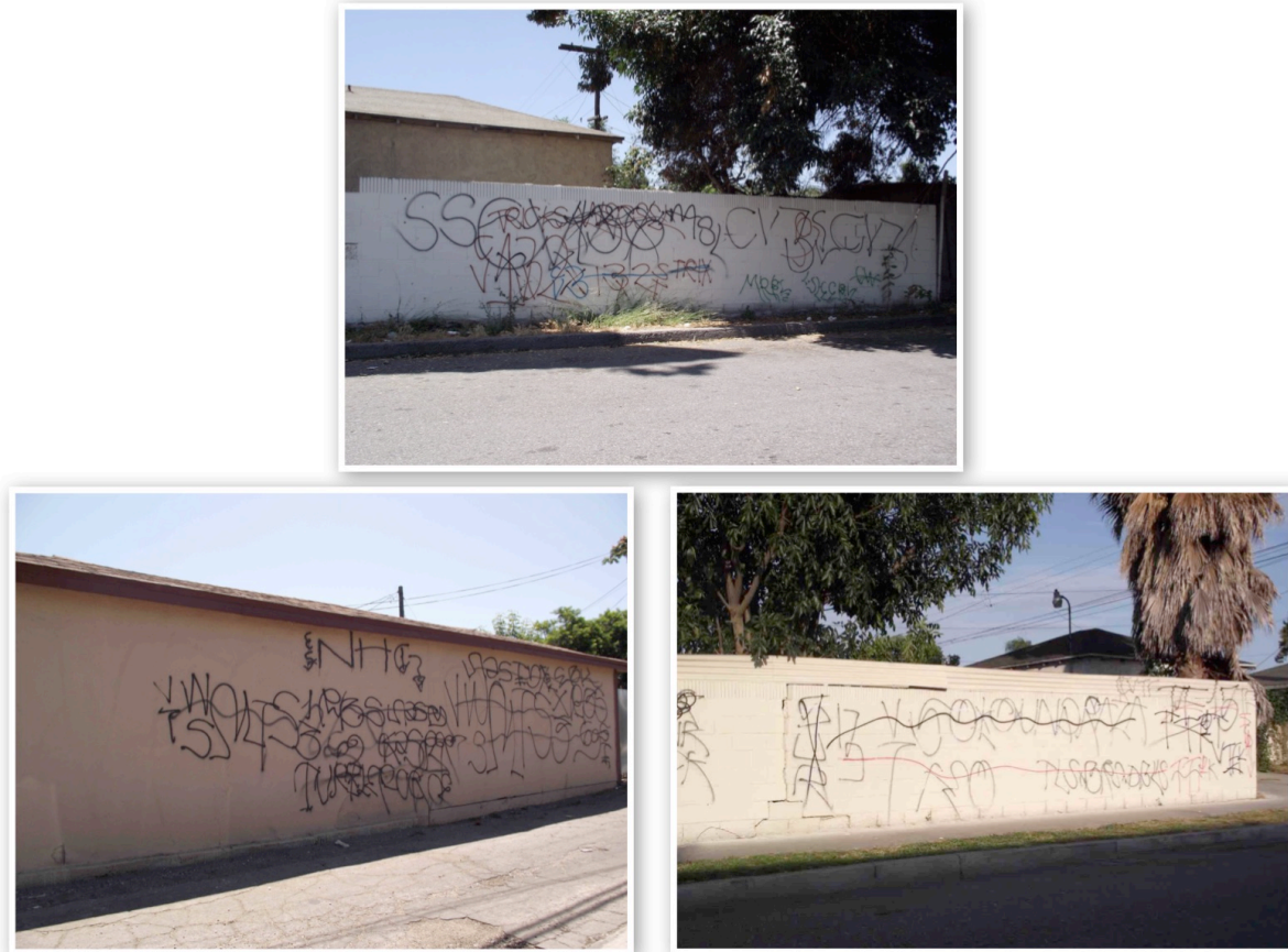
16. Murs recouverts de graffitis à l'été 2011 (Le Moigne, 2011)

L'analyse des graffitis de gangs est d'une grande utilité pour comprendre les rapports de force qui structurent le territoire dans les villes et les quartiers concernés par ces phénomènes. Ces inscriptions, parfois très sommaires, permettent à leurs auteurs de faire la promotion d'un gang et contribuent, par là même, à la matérialisation d'un territoire bien délimité (bien que souvent contesté) et de « lignes de front » sur lesquelles est perpétrée la majorité des violences (mortelles ou non) entre gangs rivaux.