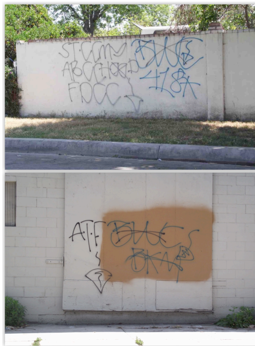
8. L'alliance ATF sur les murs de Compton (Le Moigne, 2011)

nom d' ATF ( A pour Acacia , T pour Town et F pour Farm ). Ces trois gangs réunis constituent un des ensembles les plus importants de la ville, avec près de 150 membres actifs.