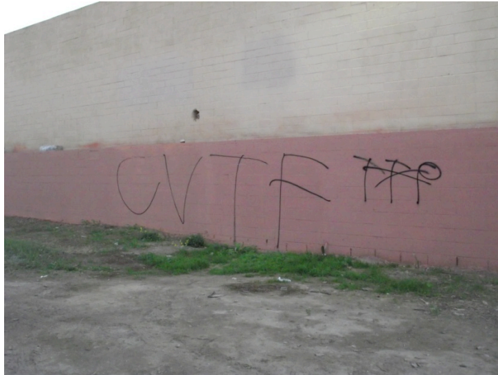
9. Un cross out réalisé par un membre des Compton Varrío Tortilla Flats (Le Moigne, 2012)

Les gangs peuvent également employer une symbolique plus complexe, comme dans l'exemple ci-dessous. Ici, un membre des TTP fait la promotion de son gang sur son propre territoire, tout en s'attaquant à ses rivaux. Il revendique à la fois la supériorité de son gang et de l'ensemble des Pirus en positionnant le chiffre « 1 » à l'intérieur du « P », et il annonce à la fois que les TTP revendiquent leur statut d'ennemis mortels des Crips et des CVTF en écrivant « CK » et « TFK », respectivement pour « Crips Killers » et « Tortilla Flats Killers », tout en rayant le « C » et le « TF », comme pour leur manquer doublement de respect.